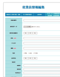
サイト入力画面の一例

無事に在留資格が得られたら、いよいよ雇用開始となります。在留資格には期限があるため、申請取次行政書士にて在留資格期限更新許可申請や登録支援機関としての支援を提供致します。