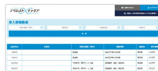
サイト入力画面の一例